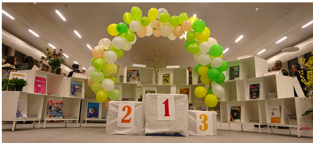
Figure 3. Podium du tournoi Mario Kart de la Learning (Centre) Party, 2024