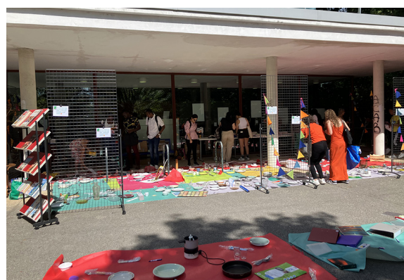
Figure 1. Troc Party 2023 à la BU Proudhon

Son action culturelle s'est peu à peu diversifiée, avec davantage d'ateliers, de débats, de rencontres et d'événements, ainsi que des expositions . Les bilans chiffrés atteignent environ 80 actions réalisées par année civile – et à titre d'exemple, l'habituelle Troc Party de rentrée (citée en #45 dans le hors-série d'avril 2020 de l'Association des bibliothécaires de France [ABF] « + de 100 idées pour changer ta bib ») représente plus de 10 000 objets récoltés, stockés, diffusés.