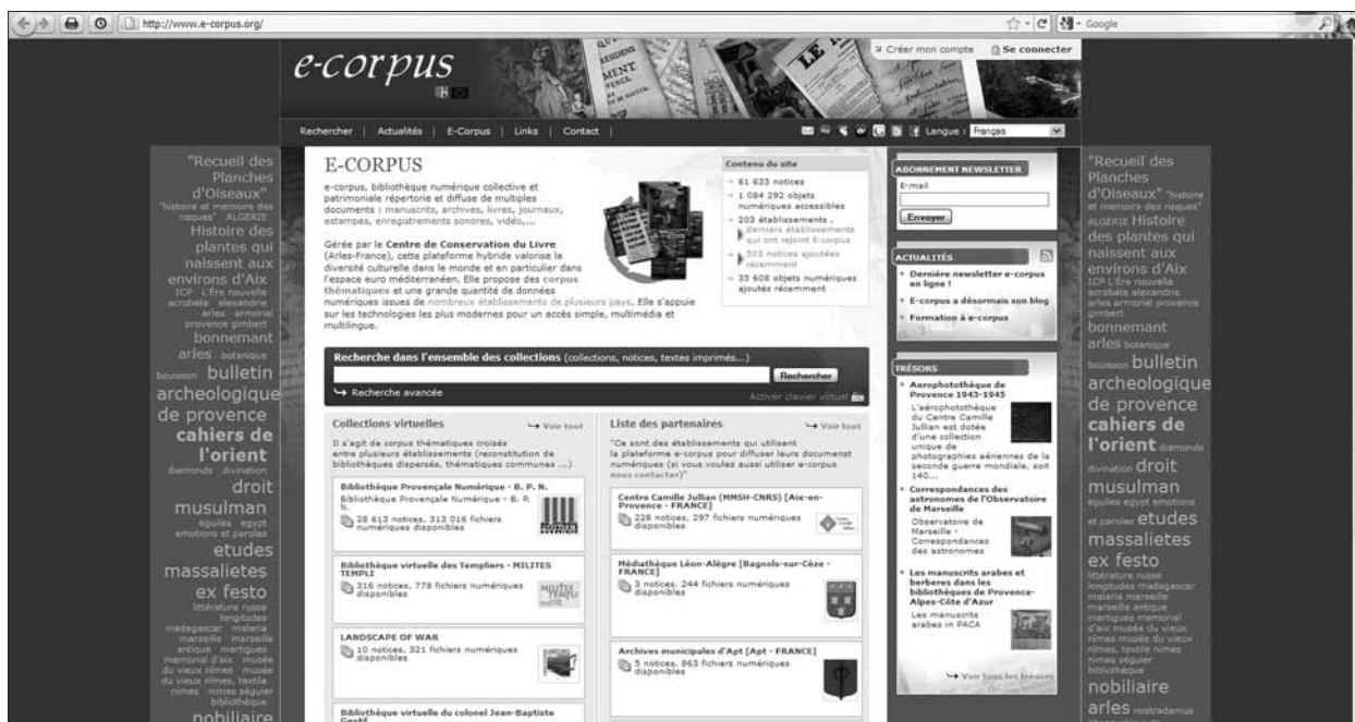
Page d'accueil de la plateforme collective e-corpus

elles se sont fortement rapprochées avec l'avènement de l'ère numérique et le développement de l'informatique (citons l'exemple de l'introduction de l'ISAD/G 3 pour le catalogage des manuscrits en bibliothèque). Envisager des bases de données et d'images communes, véritables points d'accès aux références – notamment dans le domaine scientifique –, devient non seulement plus aisé pour ces établissements, mais aussi souvent le seul moyen de réussir à mettre en œuvre des projets. C'est aussi, et surtout, le meilleur moyen de répondre aux attentes des usagers potentiels de ces ressources. Hormis quelques grosses structures de diffusion, comme par exemple Europeana 4 , les projets de coopération et de création de collections numériques communes et/ou partagées entre ces trois acteurs culturels clés sont encore peu nombreux.