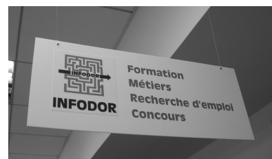
Espace « Infodor » information sur les métiers, formation et emploi Infodor = Info Documentation Orientation Recherche d'emploi

Équipement de près de 1 000 m 2 dont 770 m 2 ouverts au public, organisée en trois sections (adulte, jeunesse, discothèque), la bibliothèque offre, dès l'origine, des collections multimédias et inscrit dans son projet d'établissement la création et le développement d'un fonds spécialisé : Infodor. S'y ajoute le nécessaire travail en direction des publics en alphabétisation et des publics non francophones dans un quartier d'immigration.