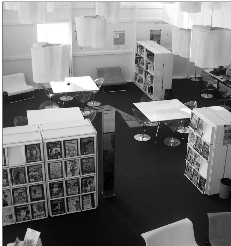
Salle d'actualité.