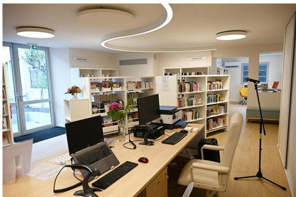
Figure 6. Centre culturel Ambille, médiathèque à Arette