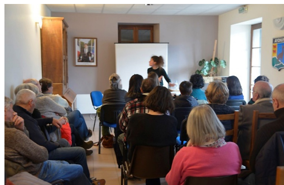
Figure 5. Printemps des poètes 2025, à Aydius

Mai-diathèques et 40 personnes en 2025 pour le Printemps des poètes 7 .