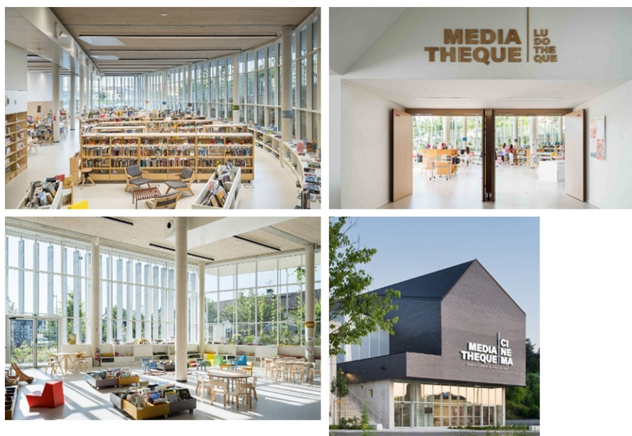
Figure 2. Espace culturel du Pays de Nay

Photos: Arthur Péquin – Projets – Atelier King Kong