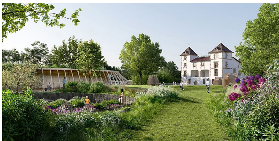
Figure 7. Future médiathèque Saint-Pierre-d'Irube dans le château de Lissage