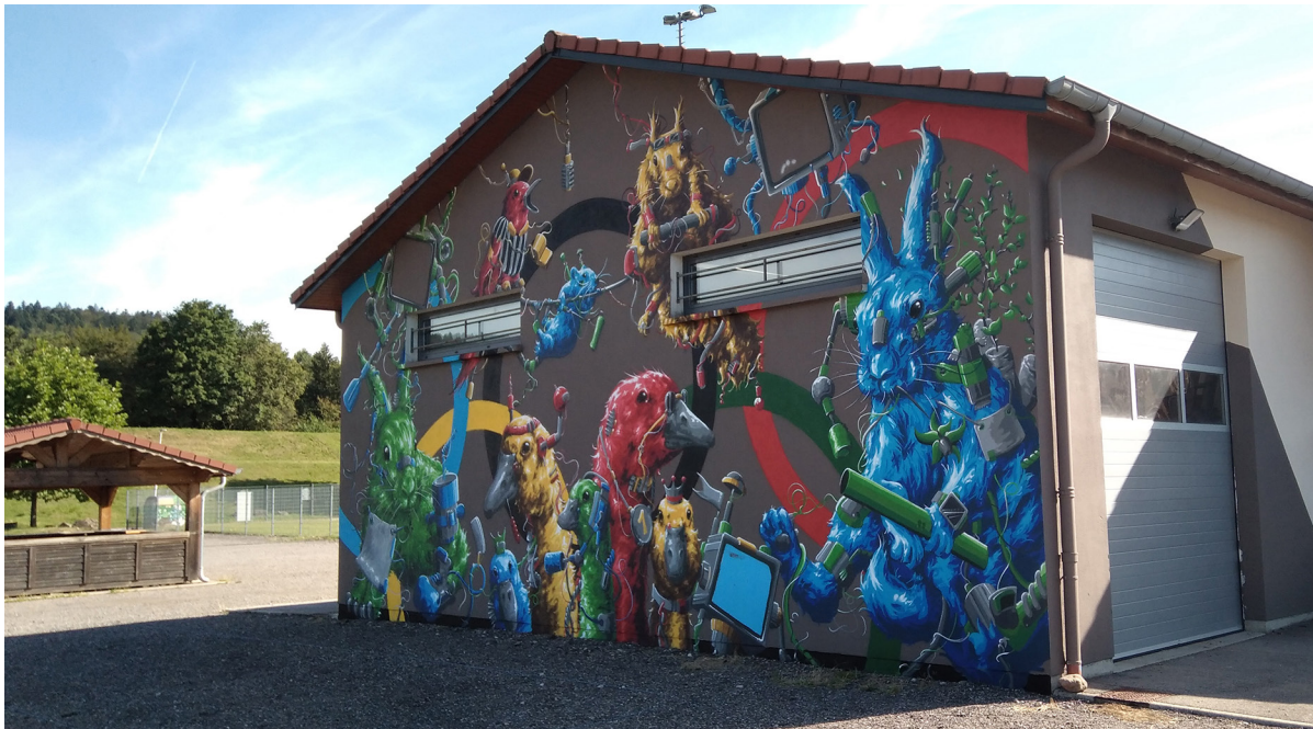
Figure 4. Fresque finale sur un mur d'un local appartenant au club de canoë kayak GESN de Golbey Épinal Saint-Nabord