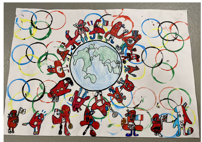
Figure 2. Lauréat de la catégorie « Œuvre scolaire »