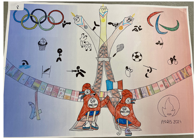
Figure 1. Lauréat de la catégorie « Œuvre individuelle »

Les dessins gagnants des trois catégories (œuvre individuelle, œuvre collective, œuvre scolaire) sont intégrés dans une fresque géante réalisée par un graffeur local sur un bâtiment sportif du territoire. La fresque intègre la notion des Jeux olympiques et paralympiques, celle de grande fête mondiale du sport olympique et paralympique, et les trois valeurs essentielles de l'olympisme : excellence, amitié, respect.