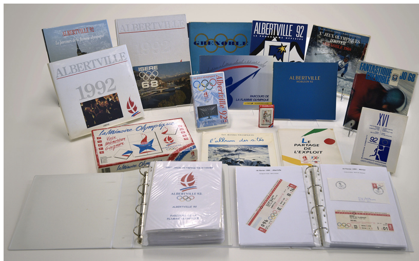
Figure 4. Bibliothèque municipale de Lyon. Documentation Jeux olympiques d'Albertville, 1992

En 1968, c'est Grenoble qui prend son tour, et en 1992, Albertville. Trois Jeux olympiques d'hiver, trois départements de la région : Haute-Savoie, Isère et Savoie.