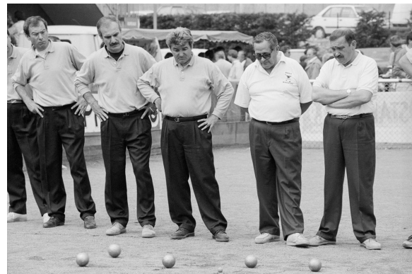
Figure 2. [82 e Tournoi bouliste de Pentecôte (1994)]

Source : https://numelyo.bm-lyon.fr/BML:BML_01ICO001015971cb289fab