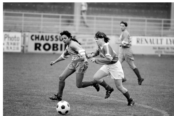
Figure 3. [Football féminin : FC Lyon - RC Flacé Mâcon (8-2) 1990]

Source : https://numelyo.bm-lyon.fr/BML:BML_01ICO0010156ddaa051542d