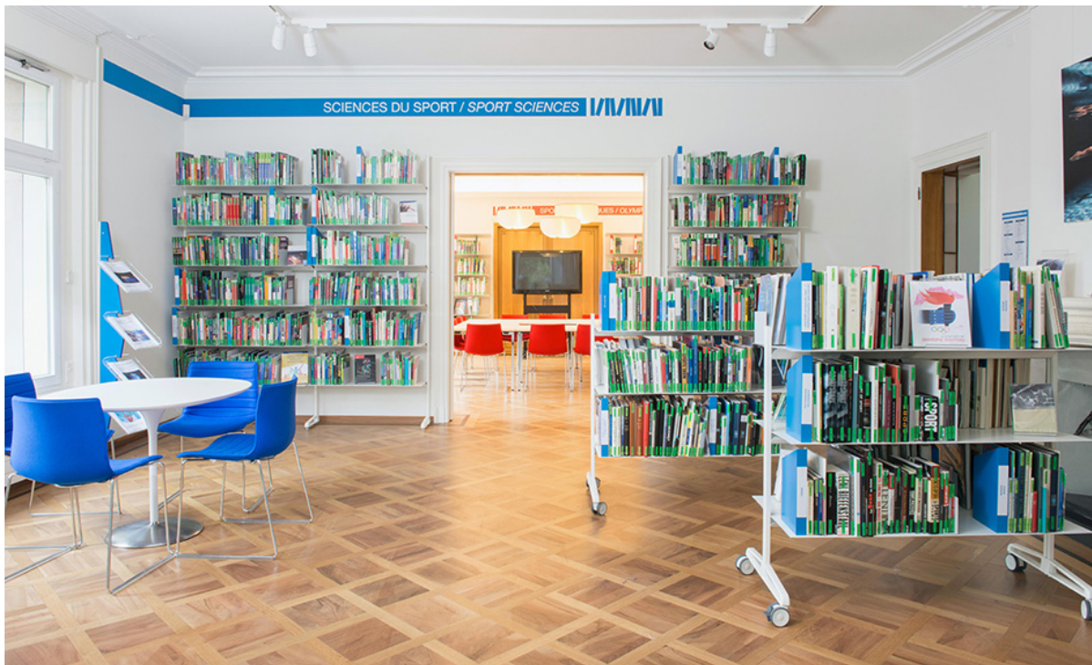
Figure 2. La salle bleue