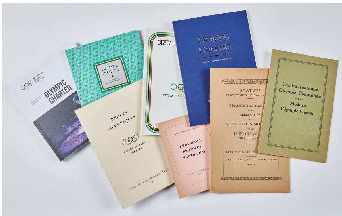
Figure 1. Éditions de la Charte olympique