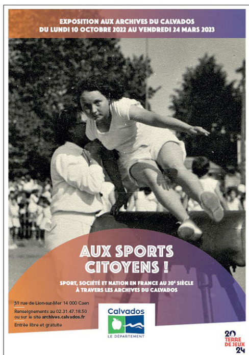
Figure 2. De gauche à droite, l'affiche de l'exposition « Aux sports citoyens » des Archives du Calvados, l'affiche de l'exposition « Rugby, l'histoire du ballon ovale » des Archives du Loiret et l'affiche de la Grande Collecte des Archives de Mayotte