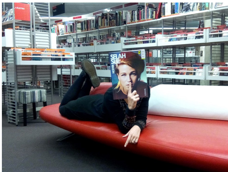
■ Figure 1. Concours de sleeveface en 2017

Le maintien de collections de CD est aussi un enjeu patrimonial. Il ne faudrait pas éliminer systématiquement le support comme cela a été le cas avec le vinyle dans les années 1990. En effet, les exemples ne manquent pas d'artistes retirant leur catalogue des plateformes musicales au gré des contrats qu'ils signent. En cela, les collections musicales peuvent redevenir une ressource. Mais comme tout enjeu de coopération patrimoniale, la réflexion doit être menée au-delà du territoire métropolitain avec les grandes institutions de conservation.