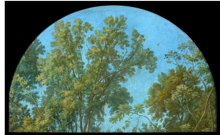
[Trois esquisses de paysages] : [projets pour les lucarnes de la salle Labrouste] : [maquette] / [Alexandre Desgoffe].

Information : 01 53 79 49 49 ou visites@bnf.fr