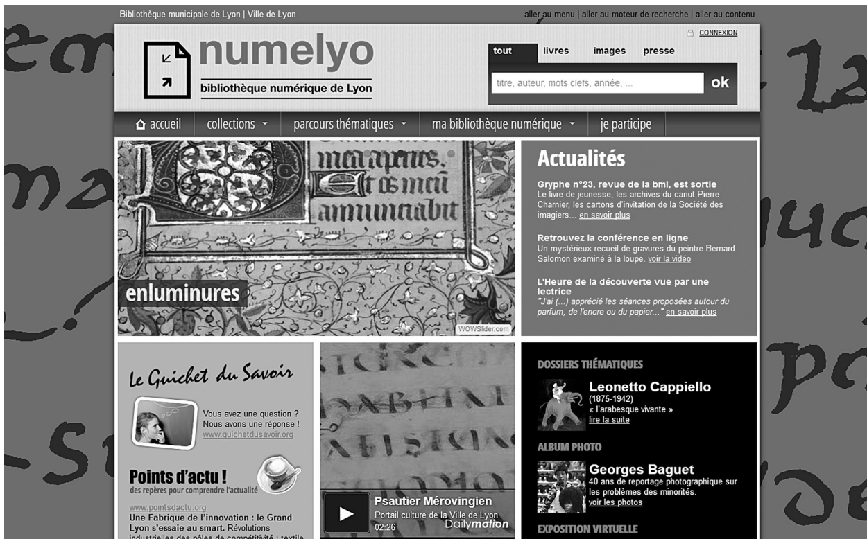
Page d'accueil de Numelyo.

pas de chercher à concurrencer un réservoir comme Google Books, mais de faciliter l'accès aux ouvrages, d'une part, en donnant des clés de recherche efficaces, d'autre part, en mettant les documents en perspective dans les parcours proposés.