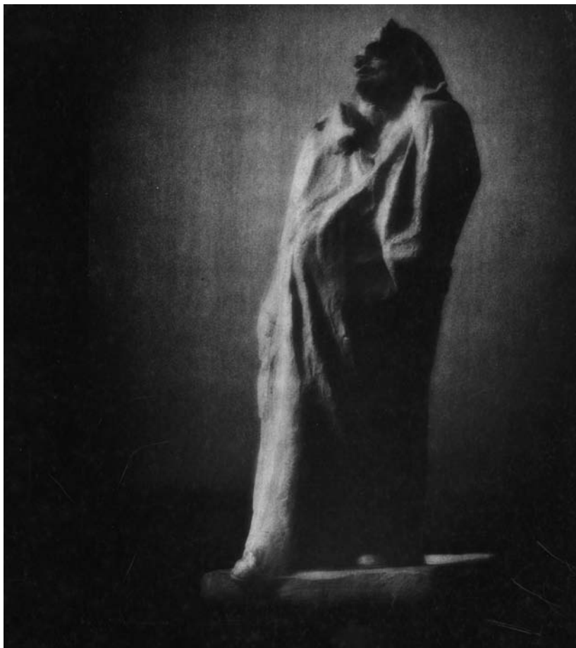
Eduard Steichen, Balzac de Rodin , 1908. Tirage au charbon et platinotype. Inv. Ph 222. Musée Rodin, donation A. Rodin, 1916

Le mot d'ordre était simple : rendre communicable au plus vite cet ensemble aux historiens de l'art de toutes nationalités. Le choix fut fait de suivre le parti pris de Rodin : tous les documents que le sculpteur avait jugé bon