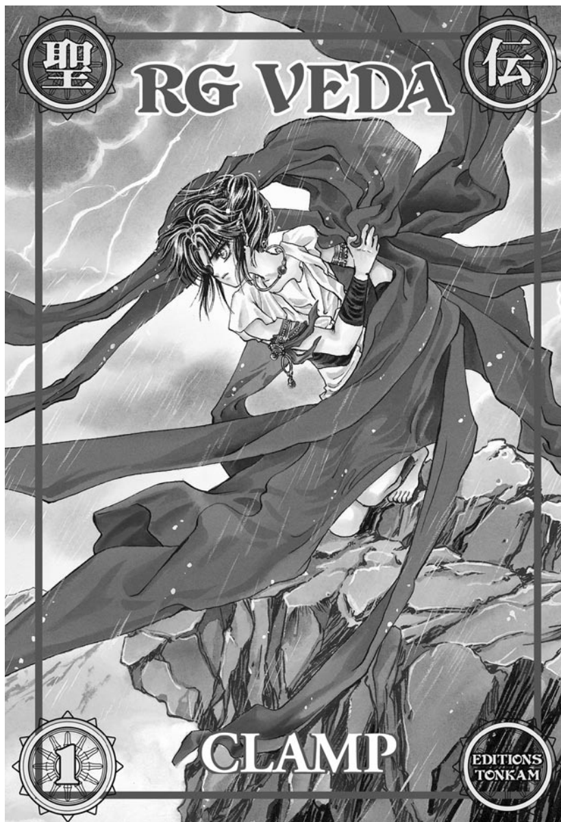
Couverture de la série RG Veda par le studio Clamp.

Au-delà de la simple question du fonds de manga et de sa légitimité au sein de nos collections, se pose aussi la question de l'action culturelle liée à la promotion de ce phénomène. Il nous semble que le manga pourrait exemplairement s'inscrire dans une politique culturelle travaillant autour de la notion de dialogue entre les cultures. Cultures occidentale et orientale, bien