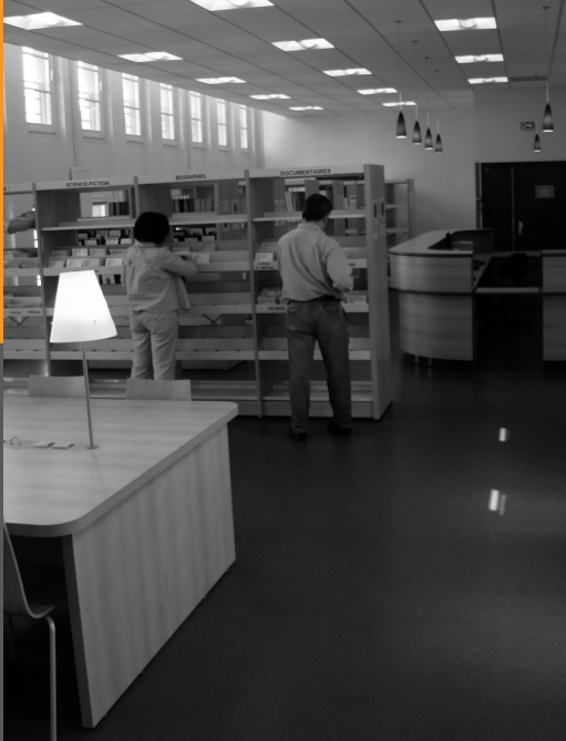
Une salle de lecture.

Toutefois, les personnes ayant besoin de documents en médias de substitution (braille, audio, numérique) ressentent souvent une vive frustration quand elles y assistent. En effet, l'animation traditionnelle est conçue comme une invitation à la découverte des collections et cela n'ouvre sur rien pour les publics déficients visuels si les collections adaptées n'existent pas.