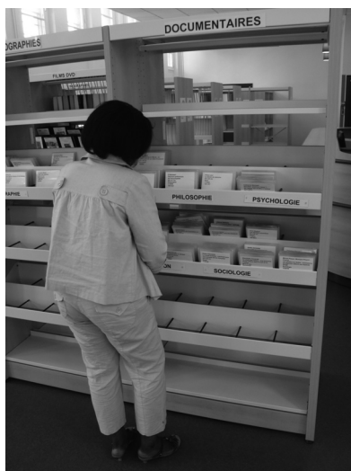
Un rayon de livres audio Daisy