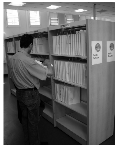
Un usager utilise la collection braille

Les bibliothécaires proposent des visites guidées à tous les visiteurs. Certains usagers ont besoin de visiter les locaux un grand nombre de fois avant d'avoir acquis des repères suffisants pour devenir autonomes.