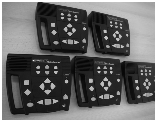
Lecteurs Daisy proposés sur place.

L'ensemble des documents est en accès libre à l'exception du braille, trop volumineux, pour lequel seule une sélection est proposée.