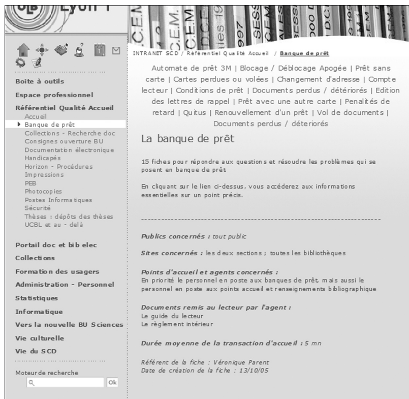
Page Sommaire de la banque de prêt.

cherche n'apparaissent pas en caractères surlignés. Seule l'arborescence à deux niveaux, accessible par la colonne de gauche d'une page type de K-Sup, nous permettait de structurer les données. Au premier niveau de la hiérarchie du référentiel, nous avons retenu une vingtaine de rubriques (cf. la copie d'écran Sommaire de la banque de prêt), afin que l'utilisateur les visualise toutes sans avoir à actionner l'ascenseur latéral. Les fiches raccrochées à ces différentes rubriques sont actuellement au nombre d'une soixantaine. Un plan du site cliquable, disponible sur la colonne de droite de chaque fiche, permet de disposer, à toutes les étapes de la recherche, d'une vue d'ensemble des données. Grâce aux liens hypertexte, nous avons pu compléter cette organisation verticale, somme toute un peu limitée, par une structuration complémentaire qui permet de passer directement d'une fiche à d'autres du référentiel sans actionner l'arborescence, et qui autorise aussi des liens