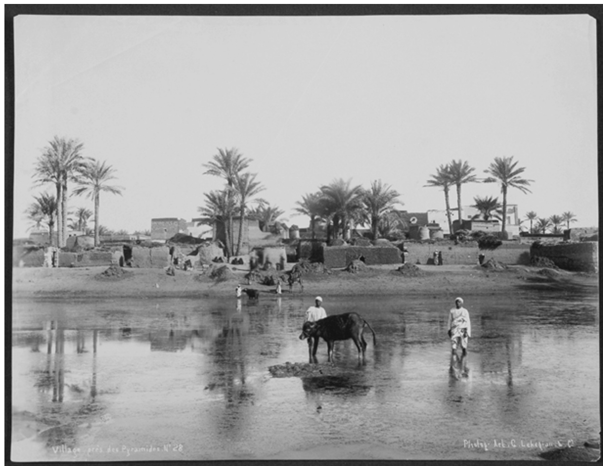
Village près des pyramides, 28. Photographie par Lekegian, s.d. extraite du fonds Normand. © Bibliothèque municipale de Nantes

à contenu politique, administratif et comptable aux archives, subit – on le voit – de nombreuses entorses.