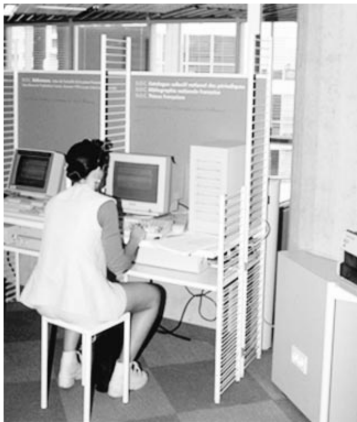
Bibliothèque municipale centrale de Bordeaux

contraindre les industriels à faire les efforts nécessaires pour mettre réellement leurs technologies à la portée du plus grand nombre » 4 .